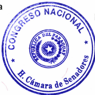
Martín Arévalo Vicepresidente 1º En ejercicio de la Presidencia H. Cámara de Senadores